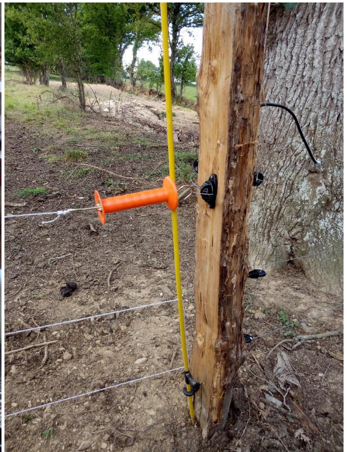
Un système de porte pour ouvrir et maintenir les 3 fils de clôtures ! Fini les nœuds !