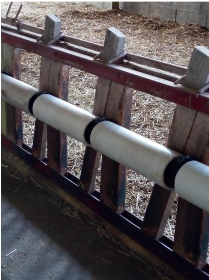
Un système qui empêche les agneaux de passer aux cornadis (Vu au Berger futé 2017)