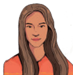
Animatrice alimentation et animations pédagogiques alimentation@civambio53.fr 07 61 53 56 94